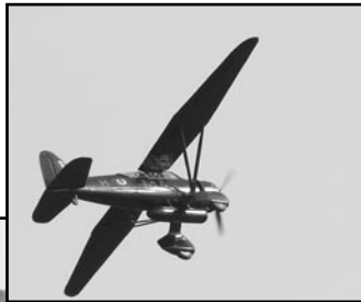
Några minnesbilder från Old Warden 2005 ur Per Bohllins kamera.