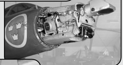
35:ans kamera-installation i nosen och vingen