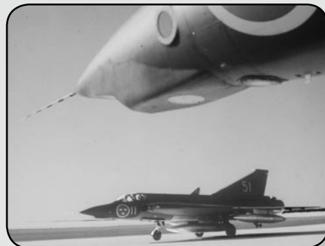
S 35E i helfigur och delfigur som visar öppningarna för kameror och sikte i nosen.

blev möjligt genom att använda ett system med speglar så att höghöjds-kamerorna, som hade