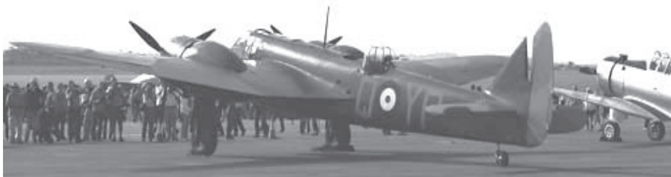
Bristol Blenheim, förmodligen den enda i dag flygande.