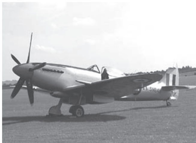
Spitfire Mk 18 - f d Biltemas plan

Finalen tycker en som har Spitfire som favorit att formationsflygningen med 17 Spitfire var, om än inte den sista punkten i programmet. En annan WW II-kämpe som de flest av oss inte sett i luften tidigare var Bristol Blenheim,