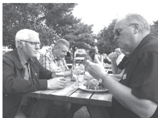
Lunch på Hendon