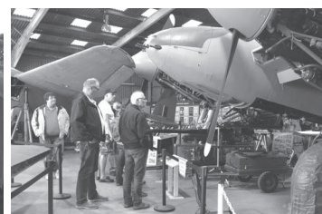
Besök på De Havilland Museum