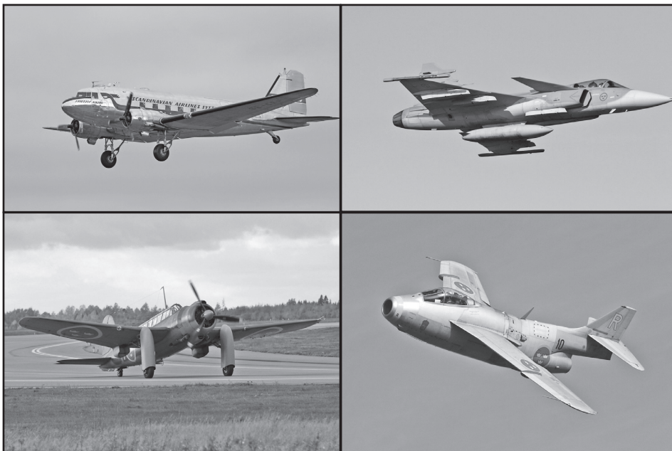
Ett axplock av de vackra maskinerna vi fick se och höra över Skavsta på jubileumsdagen. De till höger enbart i luften, de andra två även på marken.