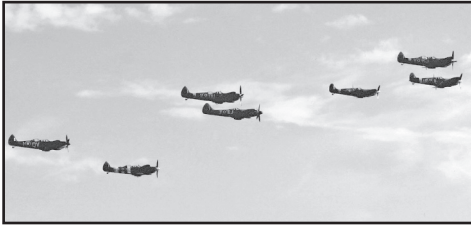
Sju Spitfire i samlad formation är en härlig ljud- och synupplevelse på Duxford.

Vi var ett 20-tal NFF-are som den 2 sept. träffades på Skavsta för att åka till England. Efter avfärden och landningen på Stanstead, väntade vår buss som tog oss till ett av våra stam-hotell, White Grange Hotell. Incheckning, och direkt ut på stan/puben. Kvällen var fri, och gänget splittrades, men alla hittade hem. Och på lördagsmorgonen väntade vår buss att ta oss till Duxford. Väl framme så blev det ett besök i Duxford-shopen, där undertecknad hittade två fina DVD om Spitfire. Några försvann ut på flightline, för att få fina bilder på de olika kärrorna. Andra försvann ut bland marknadsstånden, 1000-tals DVD, olika modeller i mahogny,