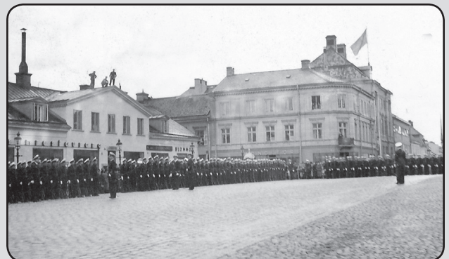
Flottiljens personal uppställd på Stora torget i Nyköping vid fanöverlämning 1942, med åskådare på tak och i fönster.