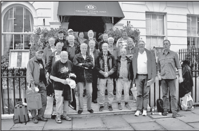
Londonresenärer, exkl fotografen på plats utanför hotellet.

och andra flygtillbehör fanns att köpa. Och ett besök i Amerikahangaren är standard. Efter besök vid en av "vätskekontrollerna", där även hamburgare köptes, så var det dags för den efterlängtda Flygshowen att börja. Alltid lika imponerande, att se Hawker Hart, Vampire (två norska gäster) Curtis P40, Lancasterbombaren och