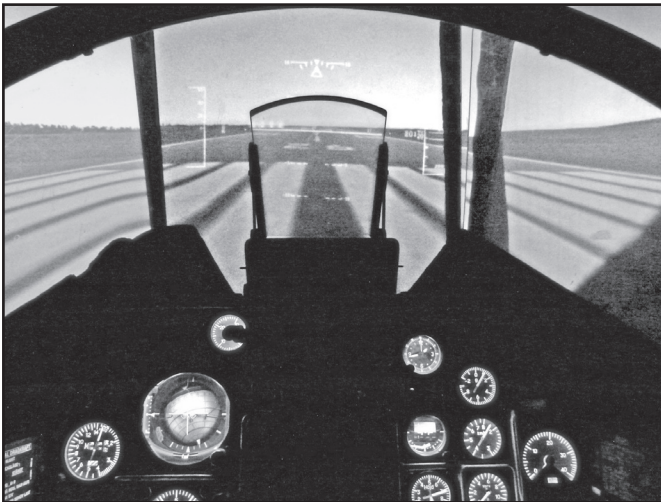
Simulatören klar för start bana 26 på Skavsta.

Ett julklappstips: Köp ett presentkort till ett pass i simulatören.