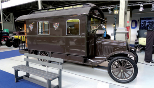
Husbil med veranda, byggd på ett Ford-chassi, från 1920-talet.

Årets NFF-resa gick till Bryssel med start onsdagen den 6 september. Ressällskapet bestog av 17 flygintresserade. Torsdagen ägnades åt olika aktiviteter. Planen var att vi skulle besöka några museer. En taxiresa bort från vårt hotell ligger museerna Autoworld Brussels och Musée de L'Aviation. Vi började med besök på Autoworld. Som senior betalar man € 8 i inträde. Det är företrädesvis många riktigt gamla bilar som man visar