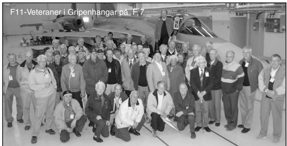
F11-Veteraner i Gripenhangar på F7

Hela vistelsen på F7 avslutades med visning av flygplanet JAS 39 GRIPEN med alla typer av vapen och last, som det kan bära. I samband med visningen förevigades besökarna genom ett foto intill flygplanet av kn Henrik Gebhardt.