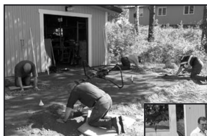
Visst grundjobb fordrade djupt handarbete

Taklagskransen är på plats och spontade brädor till taket spikas så att man kan tro att grabbarna använder spikmaskin. Det enda som begränsar arbetstakten är bristen på stegar.