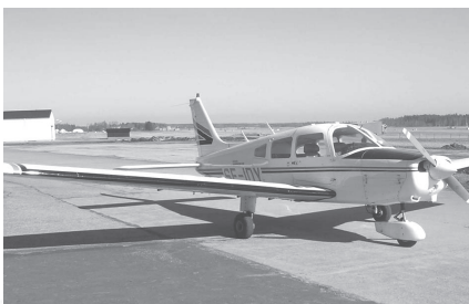
Piper PA-28 Cherokee, ett vanligt plan bland FFK:s medlemmar.