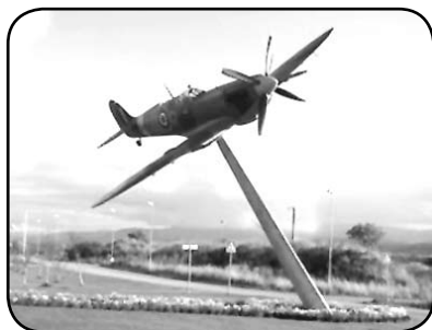
En vacker Spitfire på "pinne" i Bodø. I plast, vilket man dock måste komma riktigt nära för att upptäcka.