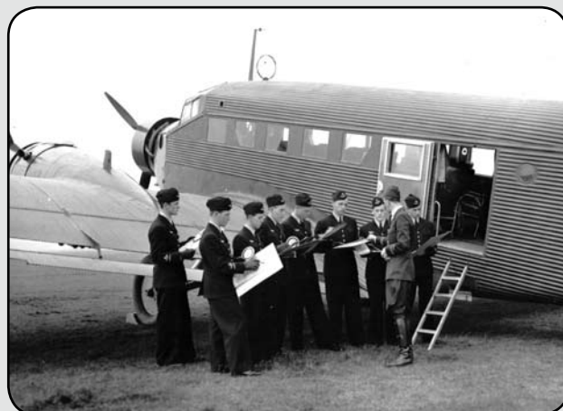
En grupp flygkadetter skall utbildas i navigation, spaning m.m. från en Tp 5 Junkers, JU-52/3M. Bilden är daterad 29/10 1943

Vid beredskapen 1939 befann sig flygvapnet i ett prekärt läge och bl.a. saknades nästan helt transportflyg. Kanske ansågs det i flygledningen att det inte fanns behov av dylika flygplan eller så fanns det bara ekonomi för inköp av krigs- och skolflygplan. Enligt 1942 års försvarsbeslut skulle behovet av transportflygplan tillgodoses genom inskrivning av trafikflygplan. I december 1942 angav också CFV i en skrivelse till ÖB vilka civila transportflygplan som skulle tas i anspråk för militära transporter. Bland dessa plan fanns bl.a. fem st Junkers JU-52/3M. Dessa avsågs användas för flottiljernas ombaseringar till krigsbaser, förflyttningar inom depåerna osv. Under åren 1941-45 var bl.a. JU-52/3M, SE-ADF Vikingaland inhyrd från ABA och tjänstgjorde i olika perioder på F 11. Till följd av minskad flygtrafik kunde ABA inte utnyttja hela sin Junker-flotta. Ju-52/3M betecknades i flygvapnet Tp 5. Någon flottilj- eller kodbeteckning hade inte flygplanen och de målades inte heller om. Planen var "neutralitetsmålade" i orange och var försedda med kronmärken tillsammans