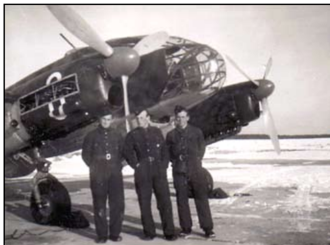
En historisk bild av S 16 Caproni i vintermiljö från Folke Lindberg, Finspång. Folke var flygskytt på Caproni och bilden är troligen från F 11. Personerna är okända. Kanske finns det bland våra läsare någon som har uppgifter om männen. I så fall tar vi tacksamt emot sådana uppgifter. Bilden är förmedlad till F11 Museum av Hasse Johnsson, fotografen.

Till alla givare framförs härmed ett varmt tack.