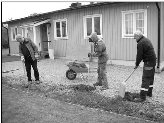
Ett gäng hårt jobbande, och för dagen engagerade grovarbetare, fixar snygga raka gräskanter utanför museet, som en del i den årliga höstputsen vid museet.

Ett stort återstående problem är dock den allt mer sönderkörda uppfarten till museets parkering. Det är den ständiga strömmen av besökare till utsiktsplatsen som sliter hårt på underlaget, speciellt märkbart när höst och regn löser upp underlaget. Kontakter har tagits med Nyköpings kommun för att undersöka möjligheterna att få hjälp i någon form för att klara underhållet av denna del. Utsiktsplatsen är kommunal parkmark och alltså egentligen inte F11 Museums angelägenhet. Men vi gör ändå så mycket vi förmår för att kunna välkomna alla besökare till en välskött utsiktsplats, som för många kanske är det första besöket i Nyköping i samband med att de hämtar och lämnar resenärer vid flygplatsen.