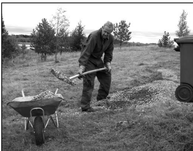
Skavsta Flygplats ger mycket värdefull stöttning av F11 Museum, som till exempel snöplogning av de tunga ytorna vid museet. Det är då oundvikligt att en del singel följer med snön ner i gräset utanför plogytorna. Här använder Hans Edelbrandt snöskyffelns för att återställa singel till parkeringsplatsen.