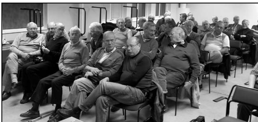
Alla förväntansfulla åhörare vid höstmötet ryms inte på samma bild i fotografens kamera. Här ses den västliga halvan av den fullsatta lokalen.