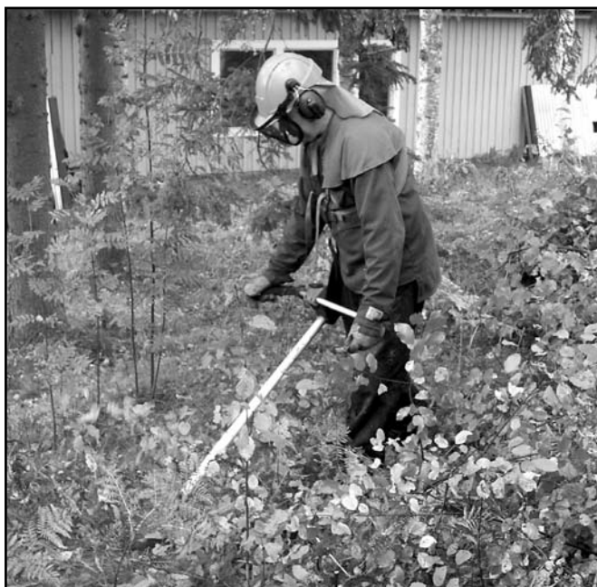
Dold under nödvändig skyddsutrustning är Mats Anderzon i aktion med röjsågen.

En putsardag med något förstärkt arbetsstyrka genomfördes i oktober, med välbehövlig uppsnygning och rensning såväl utom- som inomhus.