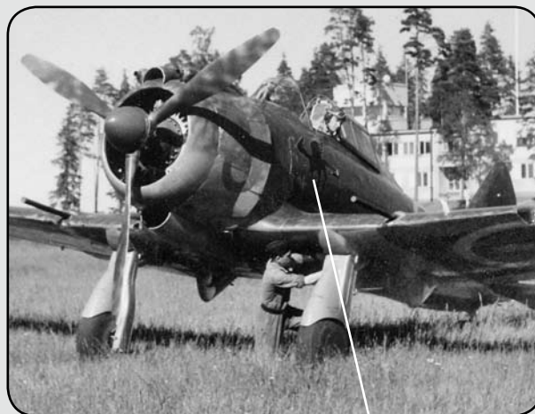
S 9C (fd J 9) under klargöring för start på fältet nedanför kanslihuset

Som spaningsversion användes flygplanet huvudsakligen för optisk flygspaning. Men en handhållen kamera typ Hk 7 kunde föraren medföra hängande i en rem om halsen. Vid fotografering öppnades huven och styrspaken hölls mellan knäna. Senare inmonterades en fast seriekamera typ Ska 4 i bagageutrymmet bakom föraren. Kameran var riktad åt höger och snett nedåt och foton togs genom den fönsterförsedda luckan till extrautrymmet. Man försökte även att fotografera under sväng med Ska 4. Föraren siktade med en kula fastsatt på antennwren.