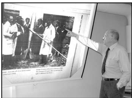
En av männen bakom V2-raketerna, Wehrner von Braun, pekats ut av Sten

Sten kunde inte bara på ett initierat och medryckande sätt berätta om Peenemünde, både som semesterort och raketbas, utan också om historien bakom tavlan.