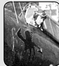
Vad är det för märklig figur som är målad på flygplanet?

Trots allt omodernt med S 9C, som dålig prestanda, kort räckvidd osv. så innebar användningen av planet att en helt ny syn på spaningsflygningen hade skapats. Man hade introducerat ett litet och förhållandevis snabbare spaningsflygplan i den svenska flygspaningen - något som hade varit en helt orimlig tanke några år tidigare. Men nu var man på det klara med det ensamma lilla fjärrspaningsplanets stora fördelar. S 9C föll för åldersstreckets år 1949 och ersattes då av det engelska fotospaningsflygplanet Spitfire MK XIX, i Sverige S 31.