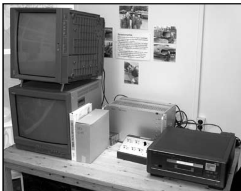
GVRS-utrustning på plats i F11 Museum

Ett värdefullt tillskott i uppbyggnaden av ett flygspaningsmuseum är en GVRS-enhet från system 37. GVRS (Ground Based Video Reply System) är ett utvärderingssystem med presentation av information från flygplanets videokameror.