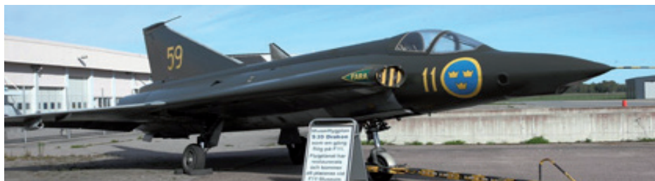
Restaurerade 35959 står utställd på Skavsta i väntan på transport upp till F11 Museum.

Kort historia: S35 fpl nr 959 började som en J35 D med nr 35281 på F 13, godkändes 630910 och modifierades sedan till S35 och godkändes 670720. S35-59 flög därefter på 2a divisionen fram till 790620. Därefter användes planet av FC fram till 1985 som FC-35. Det är fascinerande att det flögs S35 i provsammanhang ända fram till 1985, långt efter att SF37 ersatt S35 i Flygvapnet. Mer information kommer i nästa MN.