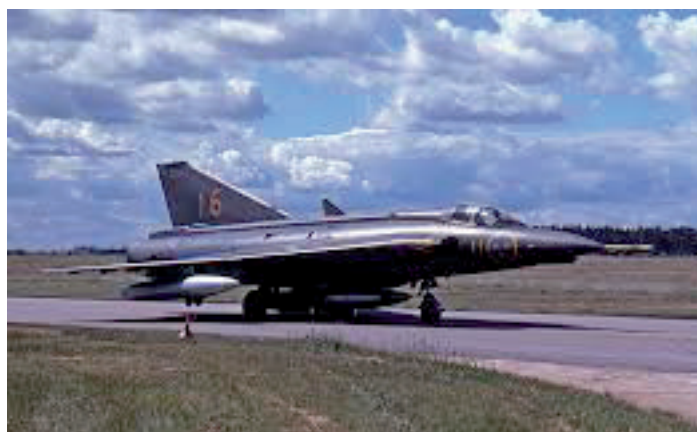
S35E med extratankar som det såg ut när det begav sig.

Fasaden på Flyghallen mot fältet har fått en uppfräschning. Nytt info-material om museet täcker nu alla fönster till vänster och höger om entré-dörren. De solblekta gamla felaktiga affischerna är borta.