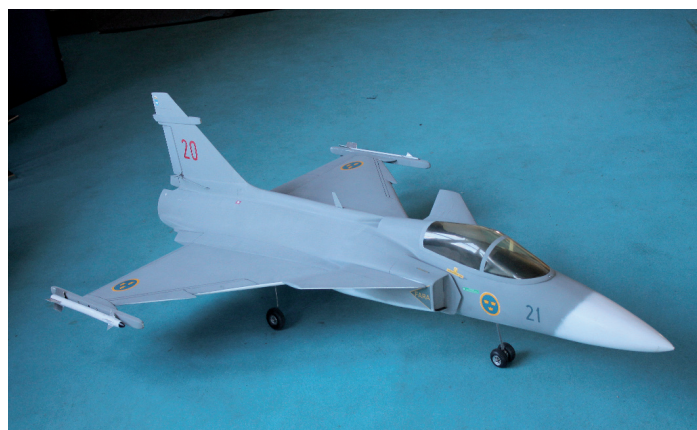
Modell av Gripen som snart kommer att sväva över vår Gripen-simulator.