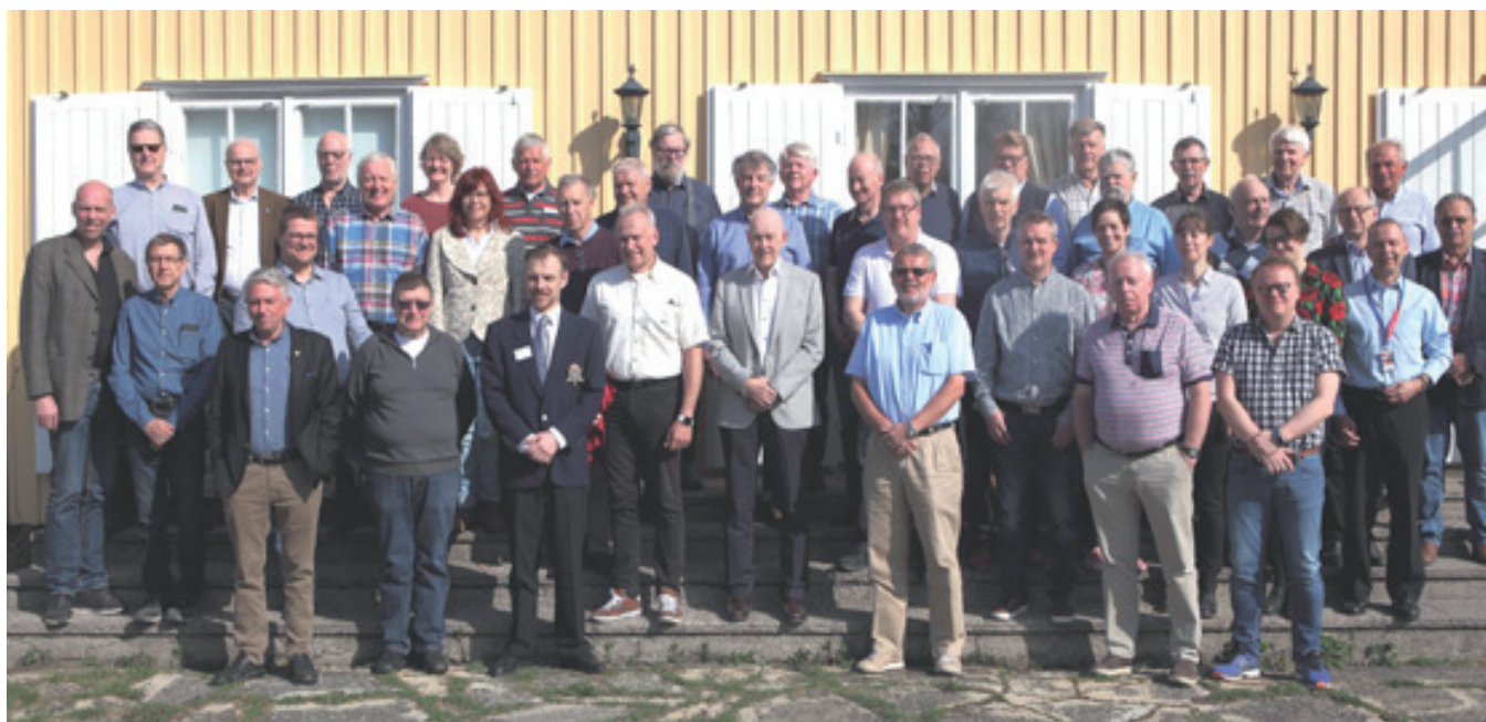
Deltagarna framför offmässen.