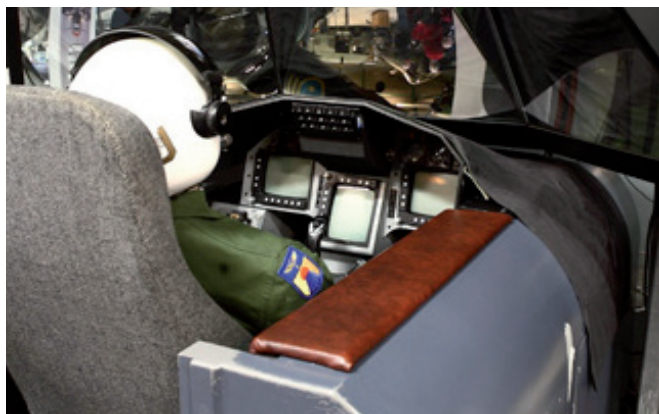
Gripen-simulatorens under uppbyggnad.

Det som drar besökare är främst upplevelser som våra unika och populära flygsimulatorer, med besökare