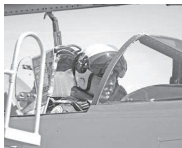
Kvällens före- dragshållare Alf Ingesson Thor inför ett pass i Swedish Airforce Historic Flights J32B