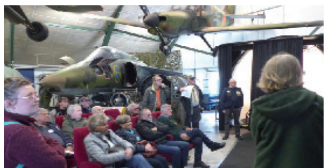
Våra simulatorer är alltid populära dragplåster

För oss museer kostade det inget för oss att medverka med denna massiva marknadsföring. Inom kort ska vi medverka i en enkät om temadagen.