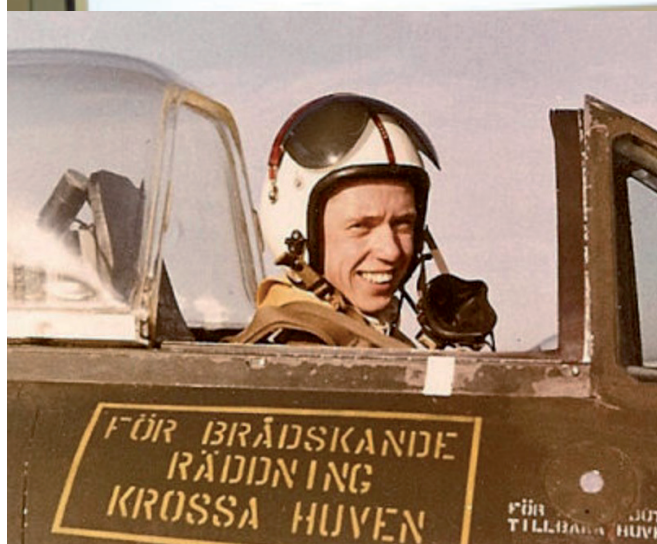
"Gamen" i sin ungdom i en Vampire. Övre bilden från hans föredrag efter NFF årsmöte.