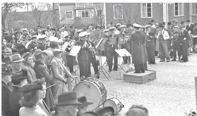
F11 Musikkår uppträder i Nyköping 1944.