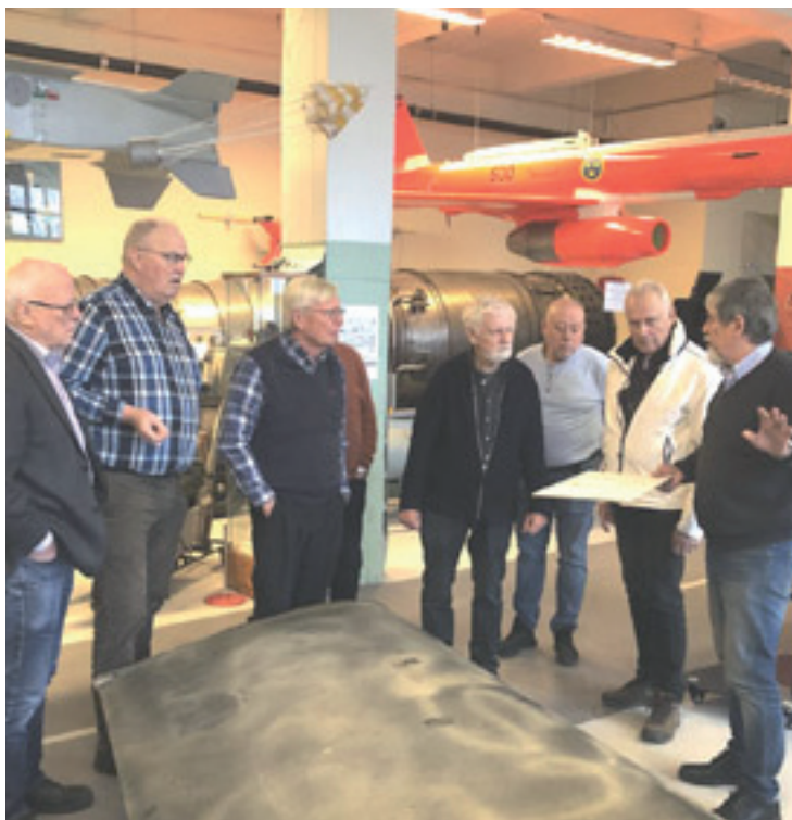
Senaste träffen var på Arboga Robotmuseum

Vi ser fram emot att tillämpa råd och erfarenheter i museiverksamheten under 2024!